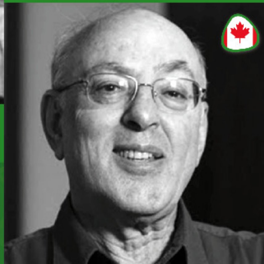
Henry Mintzberg McGill University