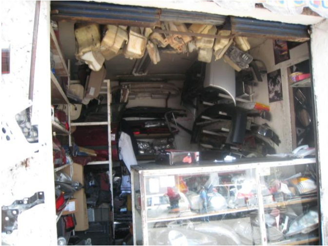
Fotografía 1. Vista clásica de una refaccionaria en La Ronda.

Para realizar una importación de Estados Unidos es necesario llevar a cabo los siguientes pasos: