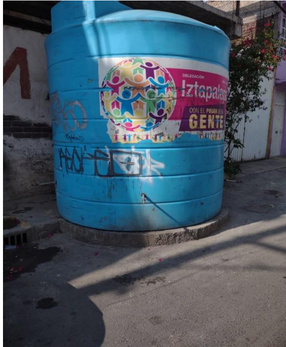
Foto 1. Un hidratante o tinaco. Una propuesta surgida de las redes sociales. Foto tomada en trabajo de campo 2022

las personas que viven cerca de la zona. Los tinacos se ubican cerca de avenidas principales y se sigue llenando. Aunque, el agua se suele utilizar para el lavado de las calles o de los autos. Sobre esta propuesta no hubo seguimiento y la propuesta se quedó solo en las tres colonias iniciales.