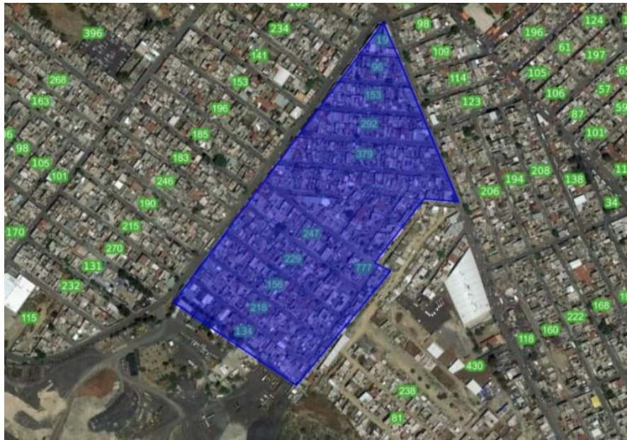
Figura 2. Polígono de la zona de estudio, la colonia El Triángulo en la Alcaldía Iztapalapa, Elaboración propia a partir de consulta de Espacios de datos de México (INEGI 2020).

La colonia El Triángulo, se encuentra en la Ciudad de México dentro de la Alcaldía Iztapalapa. Las coordenadas geográficas son: altitud de 2,255 metros, latitud 19,3222° y longitud -99.05163°. La colonia El Triángulo está situado cerca de la colonia Consejo Agrarista Mexicano y de colonia La Polvorilla los límites de la colonia inician en la esquina de Av. del Árbol y Calzada Benito Juárez, calle Porvenir, calle Salto del Agua, cerro Tehualki, hasta la Av. del Árbol, nuevamente Calzada Benito Juárez que es el punto de inicio.